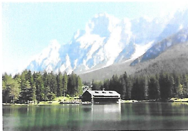
Croda Marcora e Lago di Mosigo

Il programma ricalca quello oramai collaudato: arrivo allo "Chalet al Lago" di San Vito di Cadore ( facilmente raggiungibile seguendo la perfetta segnaletica stradale ) a partire dalle ore 12,00.